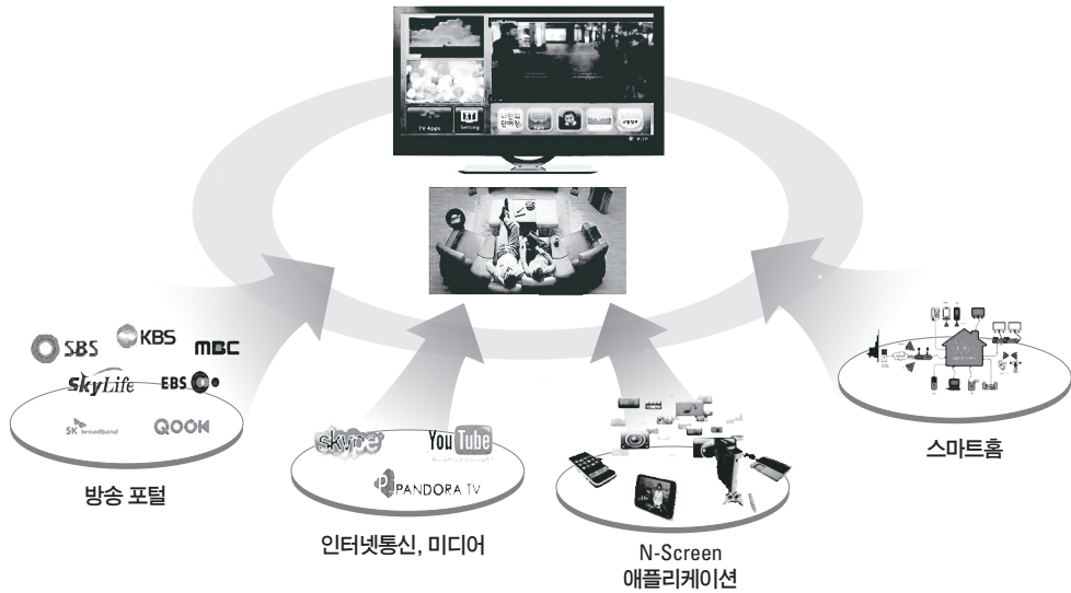
[그림 1] 스마트TV

도 강조되고 있다. 또한 소비자와 콘텐츠 공급자를 연계하여 비즈니스 장터 기능을 수행하는 플랫폼과 고품질 동영상이 보편화됨에 따라, 이를 안정적으로 서비스할 수 있는 망 확보 역시 스마트TV 경쟁력 확보 측면에서 중요한 부분이다.